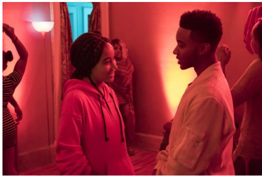
Starr und Khalil

Kenya ist Sevens Halbschwester, die Tochter von Iesha und King. Sie und Starr könnten kaum unterschiedlicher sein. Kenya ist laut, fröhlich, selbstbewusst und draufgängerisch. Die Mädchen sind beinahe wie Schwestern aufgewachsen. Sie geht auf die High School in Garden Heights und ist für Starr eine Art Verbindung zum Sozialleben der Teenager im Viertel.